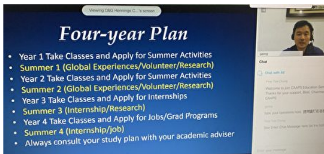
張至先院長介紹「美國大學規劃、實習與研究所申請」。

【大紀元2020年06月29日訊】(大紀元記者林丹紐約報導)「疫情影響，很多大學不要求提供SAT、ACT成績，這些成績成為可選項 (optional)，在這種情況下，凸顯了個人課外活動的重要。」27日，新澤西州肯恩大學 (Kean University) 計算機系的教授黃清郁在「美東華人學術聯誼會」舉辦的線上講座介紹，要想進入精英大學，要注重個人獨特性方面的準備，這些準備往往需要提前三、四年著手，並在申請文書上體現。