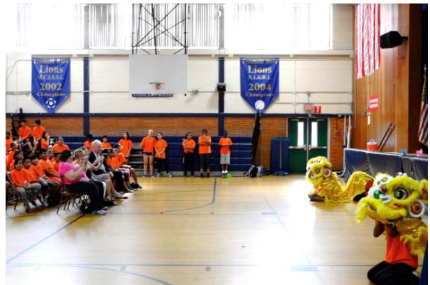
弗利何學生在結業式上表演中國傳統舞獅。