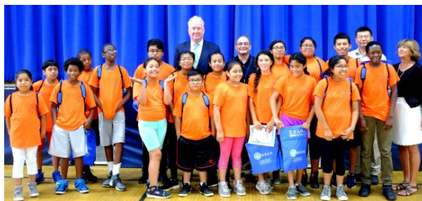
弗利何市21世紀社區學習項目學員結業，後中為市長派斯頓。