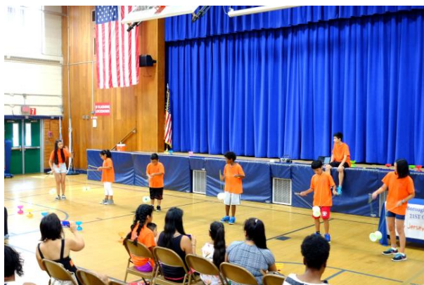
弗利何學生在結業式上表演扯鈴。