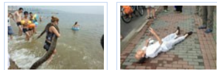
女子扛4米长蟒蛇海边戏水 上海现老人倒地无人敢扶